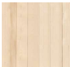
100% falegnameria di abete rosso canadese