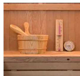
Kit sauna tradizionale incluso