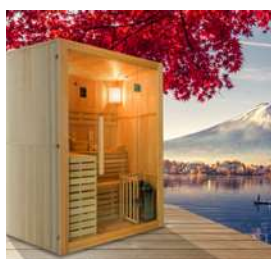
Vista panoramica grazie ad un'ampia superficie vetrata